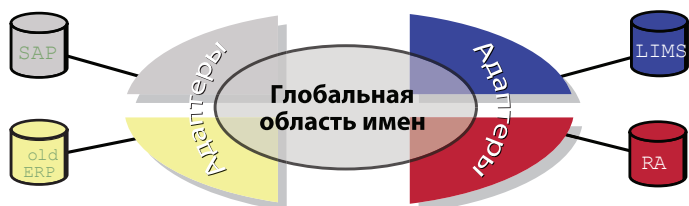
Архитектура адаптеров FactoryTalk Integrator

При реализации FactoryTalk Integrator используются адаптеры в сочетании с несколькими видами модульных настраиваемых компонентов, включая технологии совместных работ, бизнес-объекты, карты и программы обработки данных.